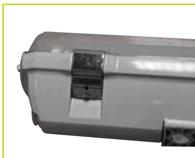
Dettaglio optional gancio inox Optional stainless steel clips detail

Electronic power supply 220/250V 50/60Hz, power cable HT 105° non-flame propagating, standard approved terminal block.